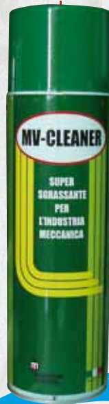
1823 MV- CLEANER SUPER SGRASSANTE PER L'INDUSTRIA MECCANICA SPRAY