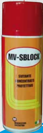
1809/C MV- SBLOCK SVITANTE CONCENTRATO PROTETTIVO SPRAY