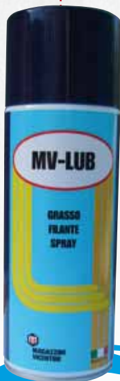
1775/A MV- LUB GRASSO FILANTE SPRAY