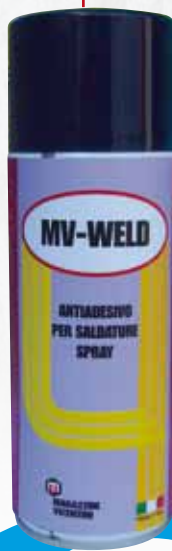
41290/C MV- WELD ANTIADESIVO PER SALDATURE SPRAY