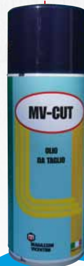
1743 MV- CUT OLIO DA TAGLIO SPRAY