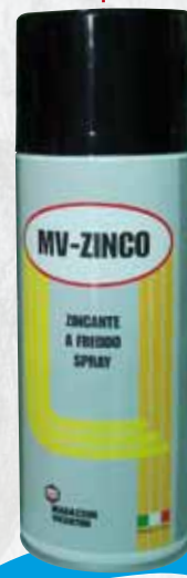
1773/A MV- ZINCO ZINCANTE A FREDDO SPRAY